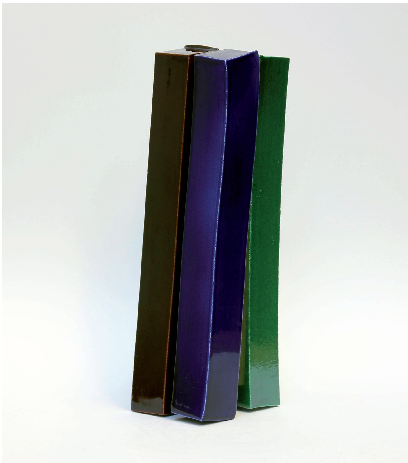
Spiraglio giallo , 2018 Grés émaillé 41 x 16 x 15 cm Oeuvre unique