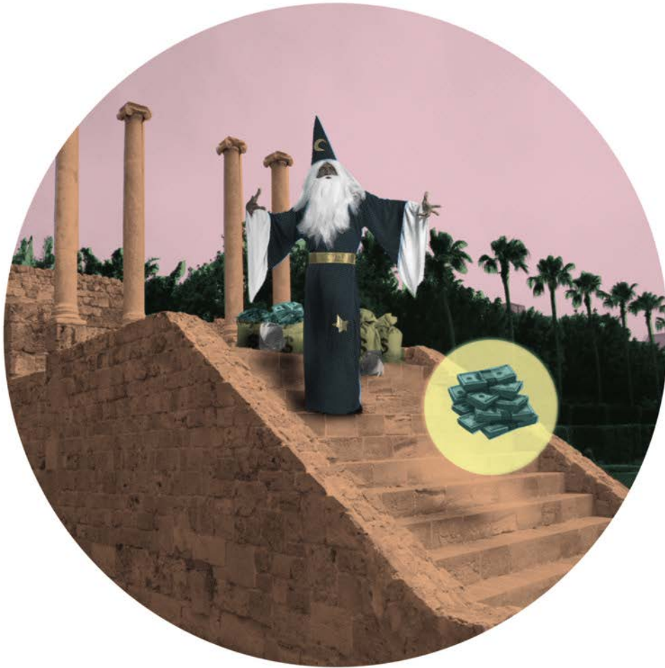
Rêve lucide n3 , 2015 serie : Rêves lucides Inyección de tinta sobre papel Hahnemühle 80 x 60 cm Edición : 3 + 1 EA