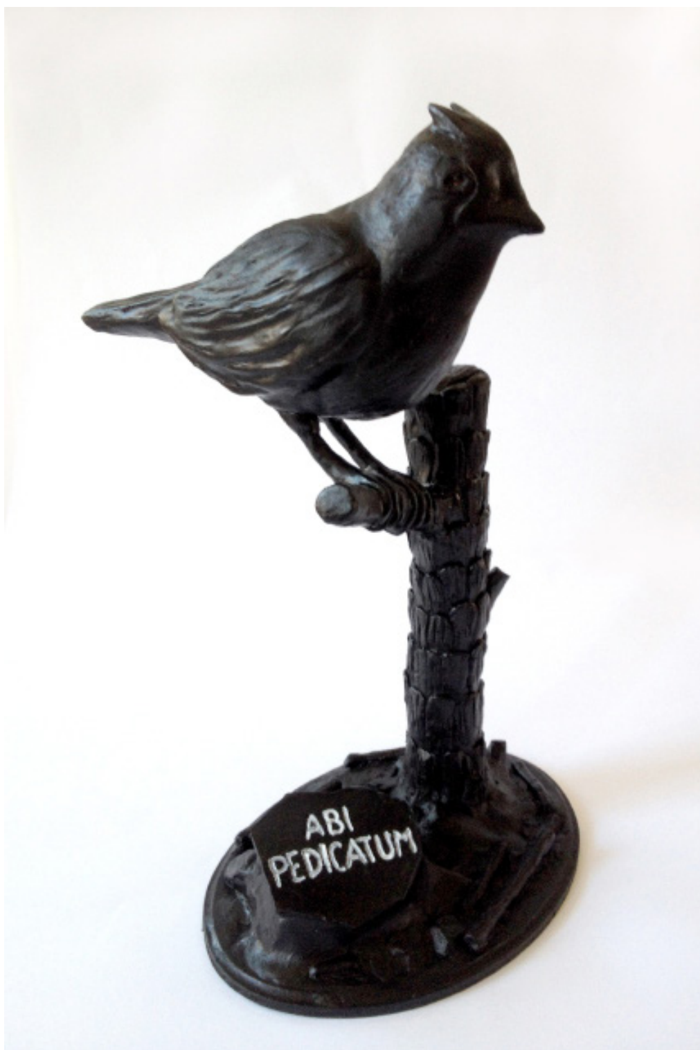
Abi pedicatum , 2016 Resina mineral, resina epoxi, madera, metal 30 x 18 x 13 cm Obra única