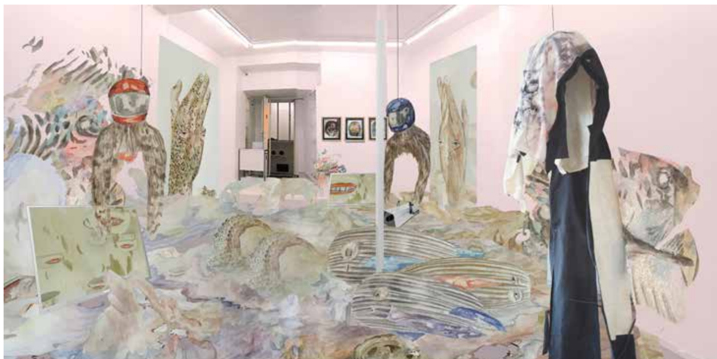
Strabisme Interne Projet de l'exposition