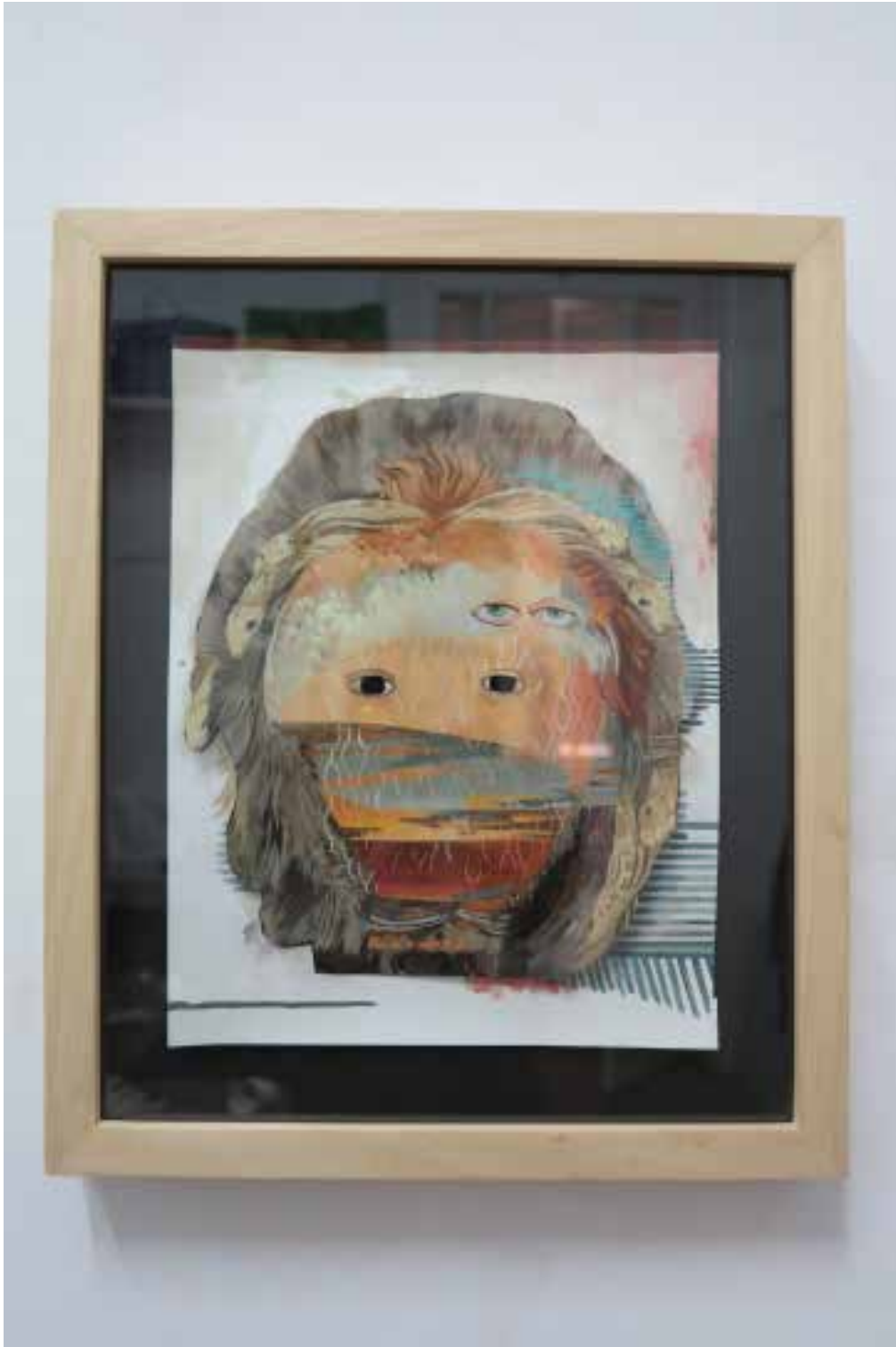
Mareaciones , 2015 Huile sur papier 45 x 37 cm Edition : 3