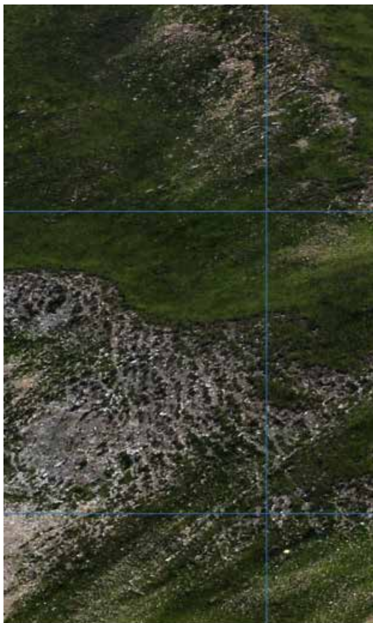
Fragment 12, 2014 Serie : Point de vue/variation Edición numérica contrecollé sobre aluminio 29,7 x 21 cm Edición : única