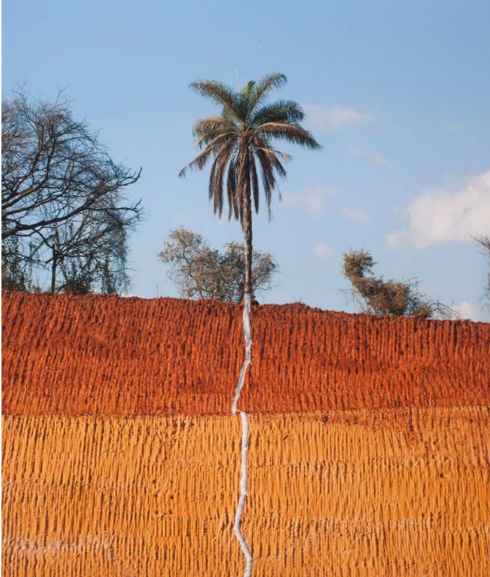
Natureza das coisas #024 , 2013 Impression minérale sur papier coton 61 x 55 cm Édition : 3 + 2 EA