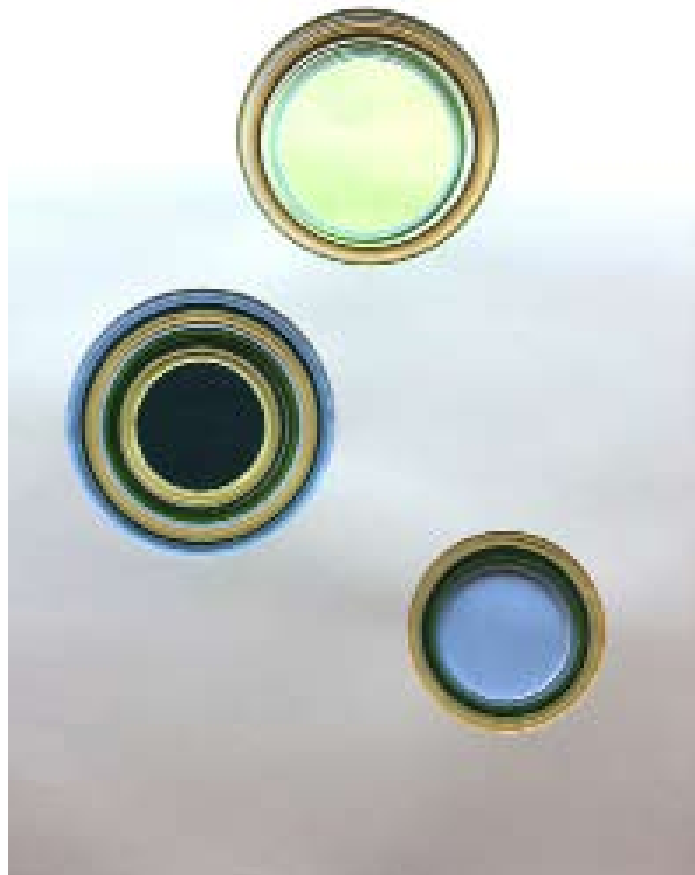
Malachita Blue , 2014 160 feuilles de papier, gouache 59.4 x 84.1 x 1.9 cm Oeuvre unique