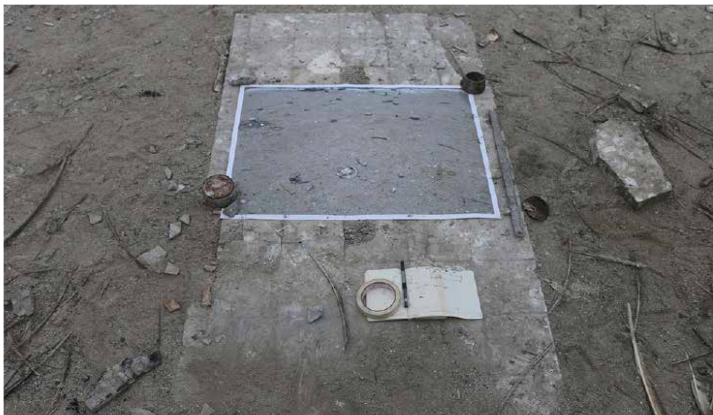
Mesa de trabajo-mapa, 2014 Mesa de trabajo (cerámica encontrada, objetos encontrados fotografía), escombros y restos de la isla del Fronton, Lima variable de Dimensión