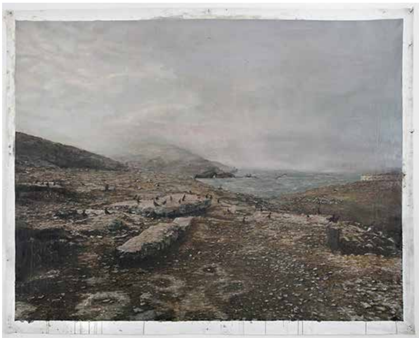
Silver 3 , 2013 Óleo sobre lienzo 220 x 190 cm